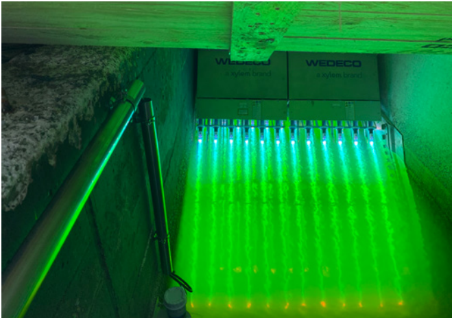
Bild 4: Auf dem Klärwerk Steinhof wird das ECOPLAS-Messsystem in unmittelbarer Nähe der UV-Desinfektion installiert.

unterschiedlichen Betriebsbedingungen und für die Erzeugung verschiedener Wasserqualitäten zum Einsatz kommen. Zudem wird das Messsystem im Bereich der Gewässerüberwachung im Gebiet der Emschergenossenschaft und des Lippeverbands im praktischen Einsatz getestet ( Bild 5 ). Insbesondere in dicht besiedelten urbanen Räumen besteht ein hoher und vielfältiger Nutzungsanspruch an Gewässer, unter anderem für die Freizeitnutzung und Naherholung. Die mikrobiologische Wasserqualität von Fließgewässern unterliegt allerdings großen Schwankungen. Zahlreiche Faktoren des Fließgewässers selbst und aus dem Einzugsgebiet haben Einfluss auf diese Dynamik wie z. B. Niederschlags- und Mischwasserentlastungen. Für Gewässerabschnitte mit intensiver öffentlicher Nutzung ist daher eine kontinuierliche Überwachung der Wasserqualität empfehlenswert. Für ausgewiesene Badegewässer werden in der Badegewässerrichtlinie 2006/7/EG unter anderem konkrete Vorgaben zur Überwachung der E. coli -Konzentrationen gemacht. Im Rahmen des Forschungsprojekts sollen Messungen an verschiedenen Gewässerabschnitten mit unterschiedlichen Randbedingungen und zu erwartenden Belastungen durchgeführt werden. Perspektivisch ist die Integration des Messsystems in ein Frühwarn- und Überwachungssystem z. B. für Badestellen denkbar.