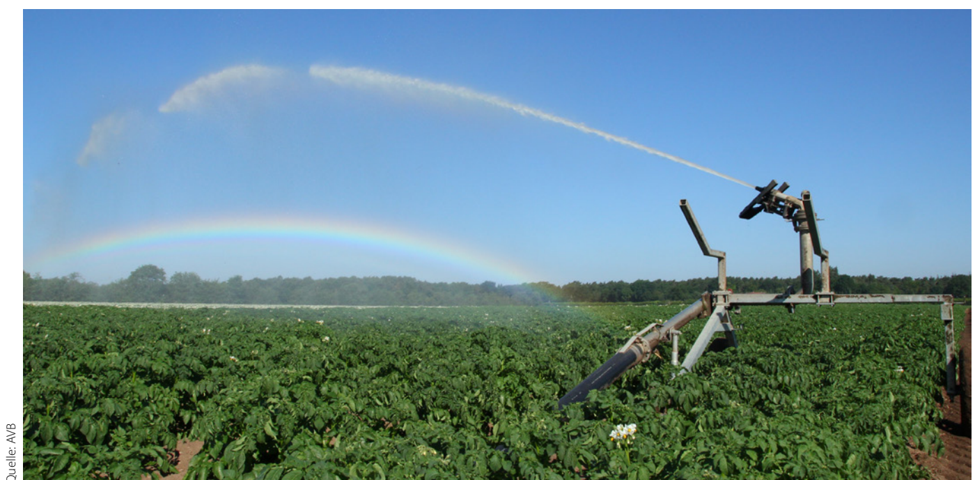
Bild 3: Anwendungsort für das Messsystem: Überwachung von Bewässerungswasser wie z.B. bei der Kartoffelbewässerung.

Auf dem Klärwerk Steinhof in Braunschweig wird Abwasser gereinigt und desinfiziert, damit es auf landwirtschaftlichen Flächen unter anderem zur Bewässerung von Energie- und Industriepflanzen genutzt werden kann ( Bild 3 ). Das ECOPLAS-Messsystem wird in unmittelbarer Nähe der UV-Desinfektion des Klärwerks Steinhof installiert ( Bild 4 ). Durch eine automatisierte Messung lässt sich eine engmaschigere Überwachung der Desinfektionsstufe realisieren und eine Steuerung der Desinfektionsanlage ermöglichen. Im Projekt wird angestrebt, basierend auf dem Messsystem ein Regelkonzept für UV-Anlagen zu entwickeln, sodass die gemessenen Restkonzentrationen der E. coli die Intensität der UV-Strahlung direkt beeinflussen. Innerhalb einer mehrmonatigen Messkampagne ab voraussichtlich Ende 2026 wird das Messsystem bei